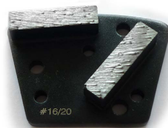
SÉRIE NOIRE bétons mous LIANTS DURS