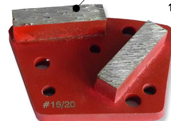
SÉRIE ROUGE bétons standards LIANT MÉDIUM