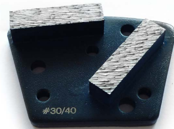
SÉRIE BLEUE bétons durs LIANT TENDRE

Bon à savoir, des calibres plus gros ( 6/16 ) ou des diamants PCD (poly-cristallisés) sont préconisés pour enlever les épaisseurs plus importantes.